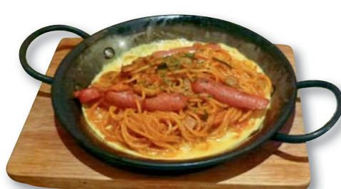
▶イタリアンスパゲッティ! 細めの麺にふわふわ卵とソースが絡んで絶妙。