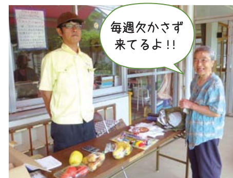
毎週欠かさず 来てるよ!!