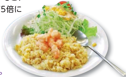
▶お食事メニューではエビピラフが大人気。