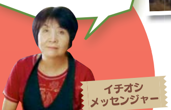
イチオシ メッセージャー