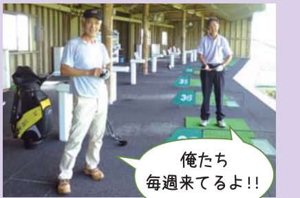
俺たち 毎週末てるよ!!

●毎週水曜日 11:00~15:00 ●連絡先/52-2123 (高浜南部まちづくり協議会)