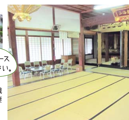
このスペース お使い下さい。