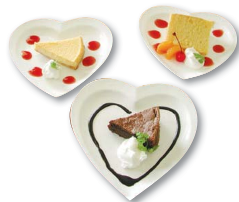
▲可愛いお皿に美味しいケーキいろいろ。季節のデザートもおすすめ!

モーニングやランチももちろんオススメです。ティータイムには手作りスイーツが楽しめます。さらに、お得タイムにいきいき健康マイレージ通帳を提示すると、季節のデザートのサービスがあります。