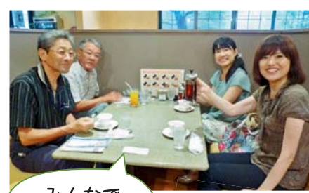
みんなでカンパイ!!

(神明町 1-7-5) ●毎週火～日曜日(月曜日定休) 7:30～21:00 ●【お得タイム】14:00～17:00 ●連絡先/52-3539