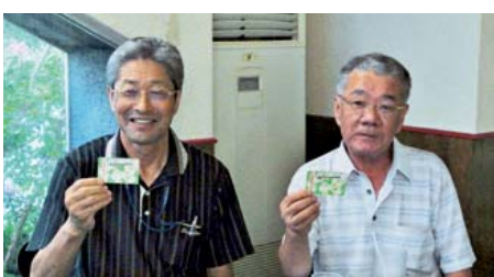
すまいるカードポイント5倍ゲット!!

(湯山町 4-2-4) ●毎週水～月曜日(火曜日定休) 喫茶8:00～20:00 ●【お得タイム】14:00～18:00 ●連絡先/52-1323