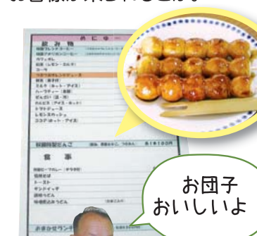
お団子おいしいよ!