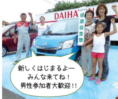
新しくはじまるよー みんな来てね! 男性参加者大歓迎!!