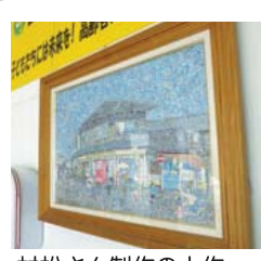
村松さん制作の大作