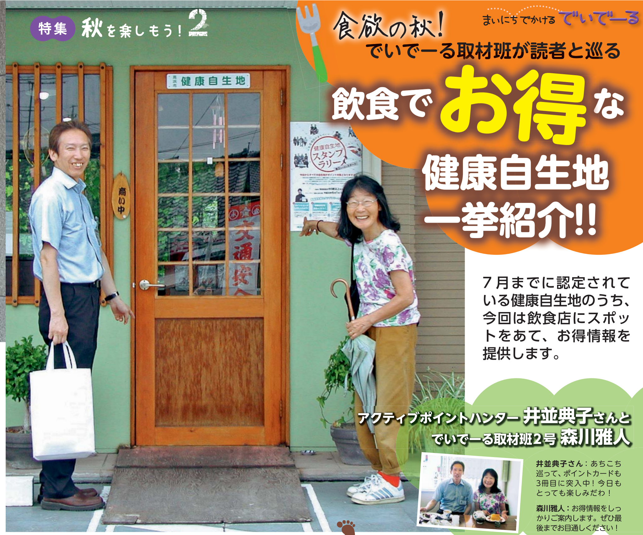
倭風茶屋 奴國の前で「さあ!入るわよ!」